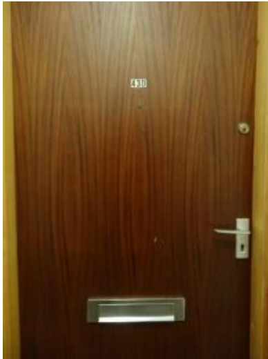
No problem behind this door