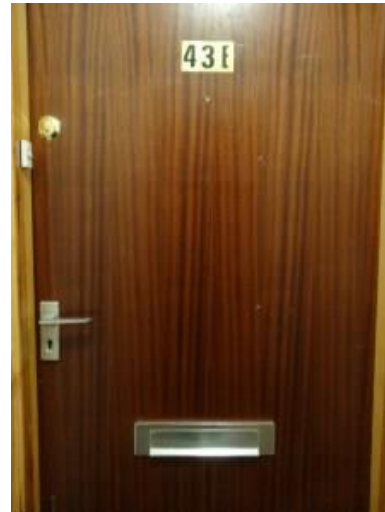
All problems behind this door