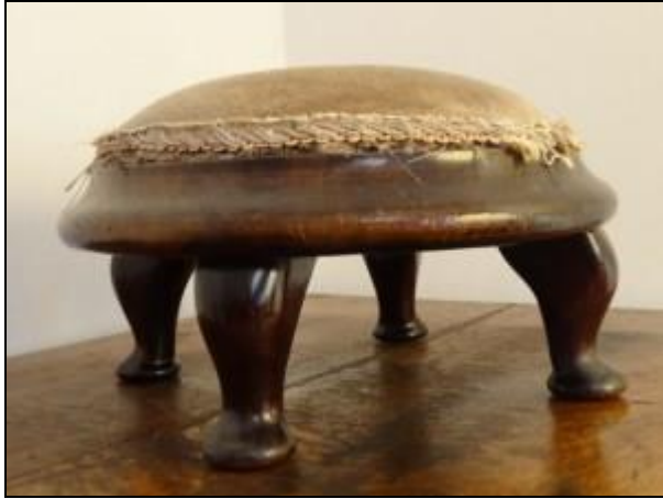
Obstacle to be climbed over

I have such a poor command of English that I feel like a baby, a baby who slows conversations down, a baby who can only express pathetic simplistic ideas, and even then badly. That said, I have heard some good news about babies. It seems that babies are very helpful: before they are damaged by education they have a great capacity for empathy. If a baby is playing with wonderful toys on a very soft carpet and someone in the same room suddenly finds themselves in difficulty, this let's say fourteen month old baby, who is just learning to walk, this baby will abandon its toys and its soft carpet in order to go to the aid of the person in distress: it walks as best it can, climbs over any obstacles, then helps the person. And it will not leave to go back to its wonderful toys until it is sure that everything is under control. That is the kind of baby I would like to be: I would like to climb over obstacles to help people in distress, people who stumble because of the problems they have with other languages, like Japanese or Serbo-Croat.