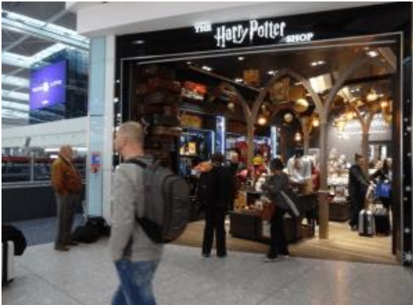
Security – Harry Potter

At London Heathrow, as soon as you have gone through security, and before the luxury goods shops, there is the Harry Potter shop.